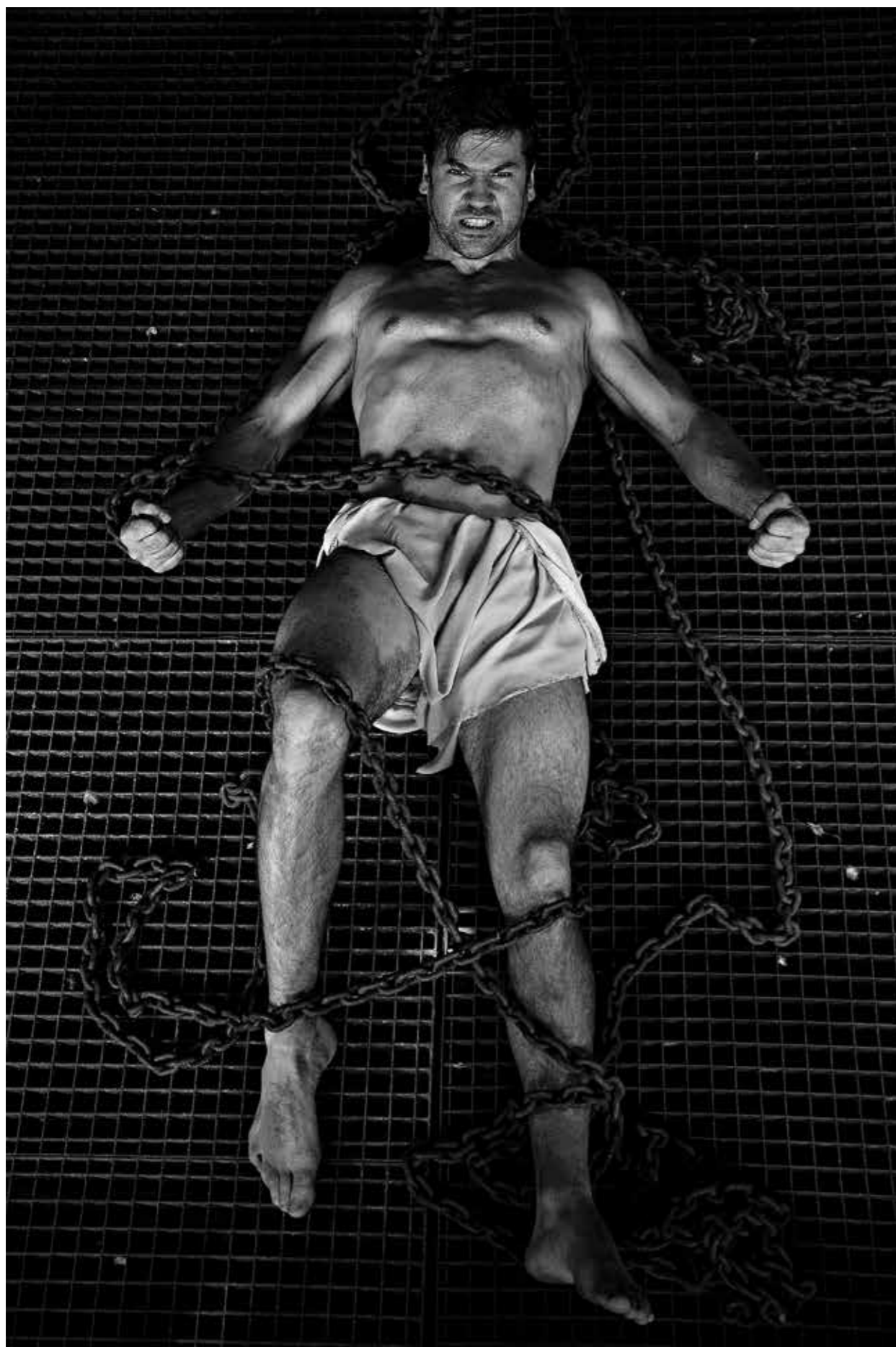
↑ Íkaros 1