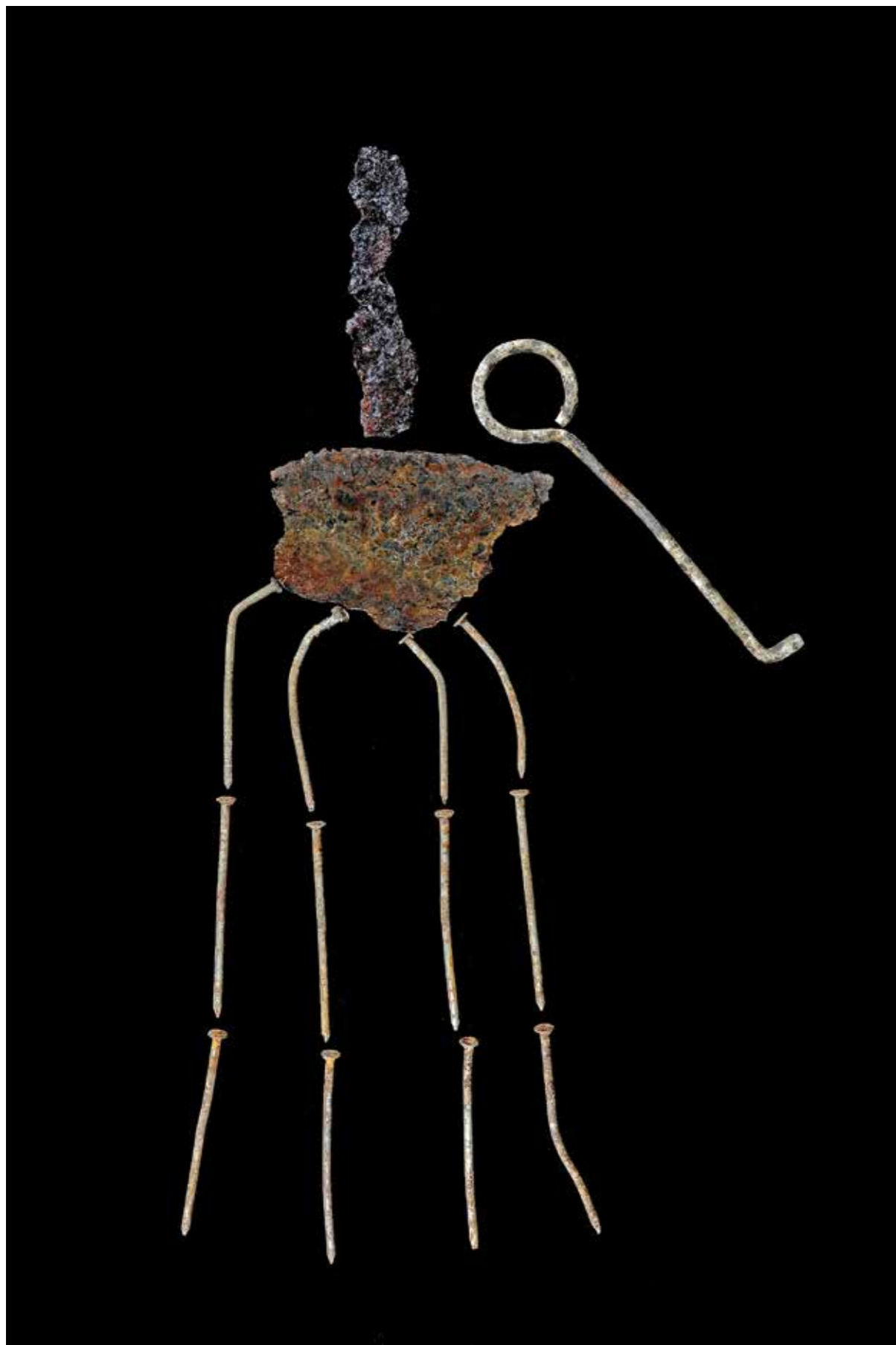
↑ Obraz podle Dalího II