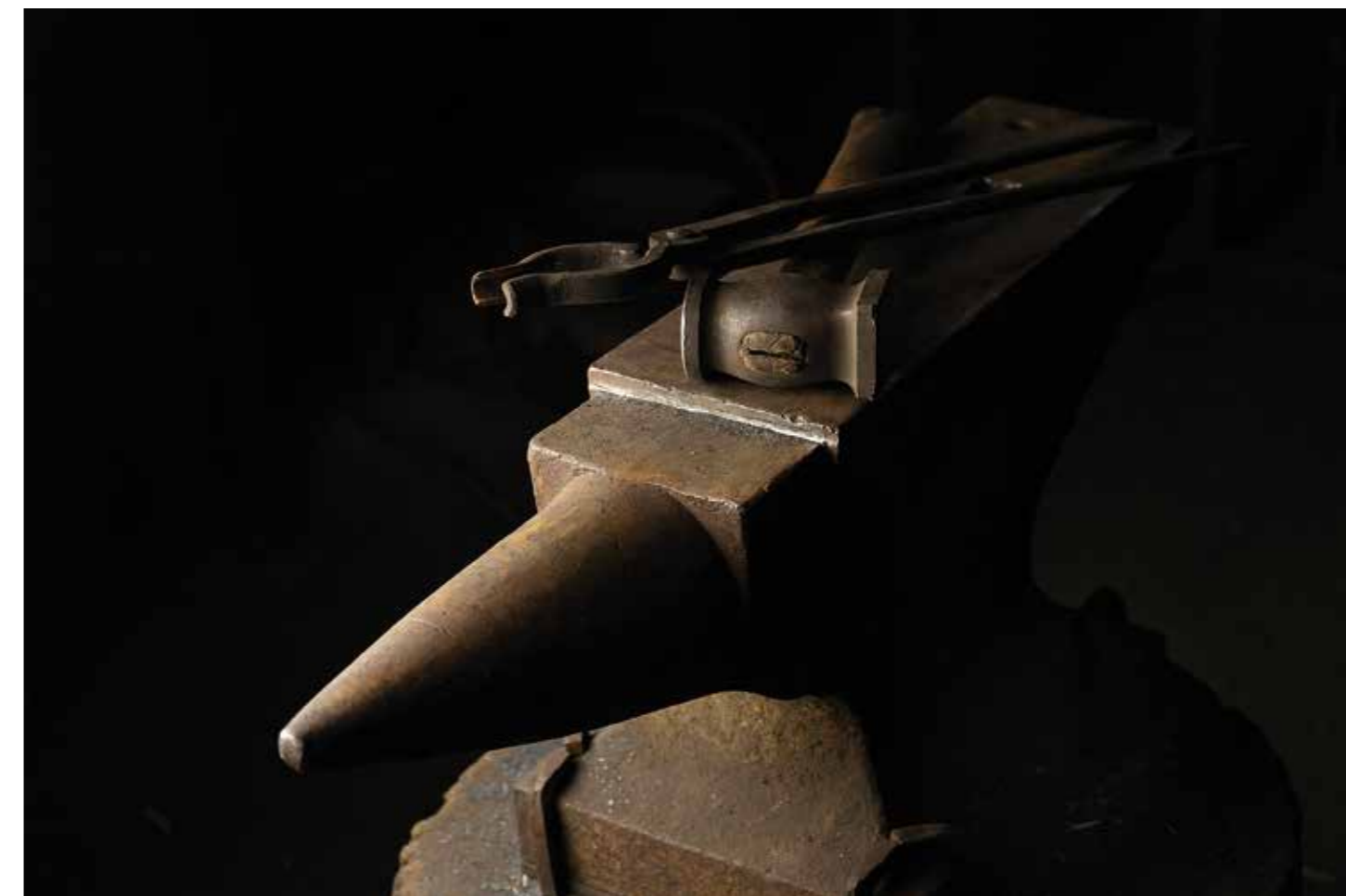
↑ Kovadlina s nářadím