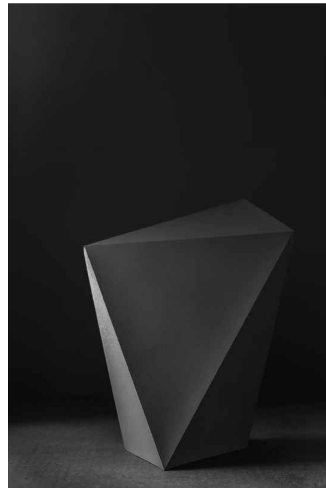
↑ Černá na černém

Jak jsme dostávali úkoly, začal jsem nad tím přemýšlet a nechtěl jsem to odfláknout. Když už něco na konzultace přinesu, ať to stojí za to, ať je vidět, že jsem si s tím dal práci. Proto jsem začal zátíší hodně aranžovat. Nápady si píšou do velkého sešitu a pak se k nim vracím. Teď už tuším víc jak na to. Zjistil jsem, že aranžovaná fotografie je opravdu něco pro mě, v tom jsem se skutečně našel.