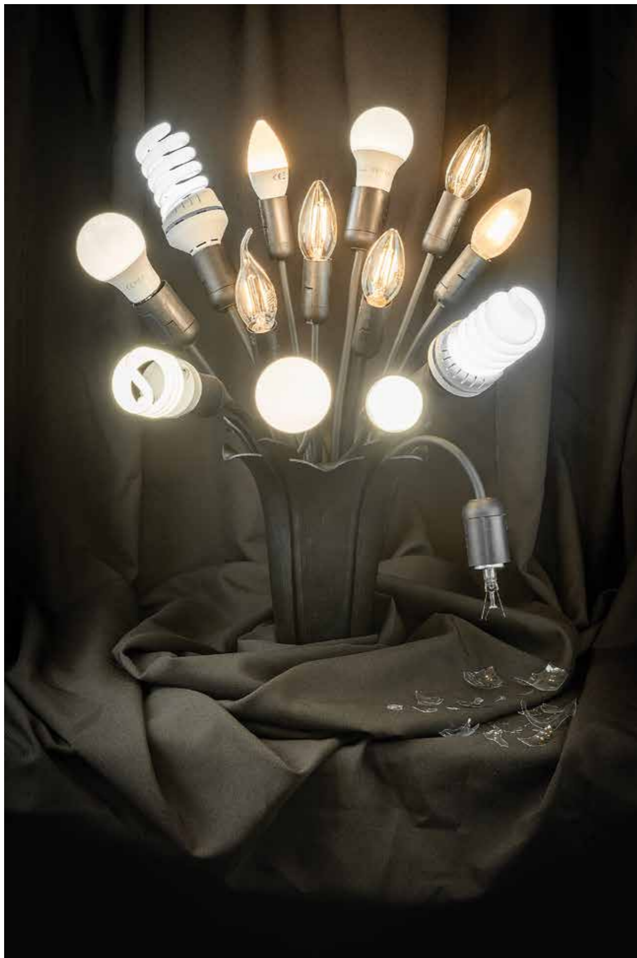
↑ Zátíší – konec jedné éry